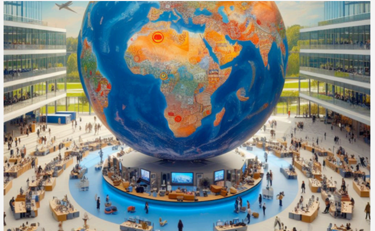
“TUM Global Week 2024 am Campus in Garching” (mit KI generiert)